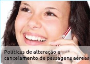
Políticas de alteração e cancelamento de passagens aéreas